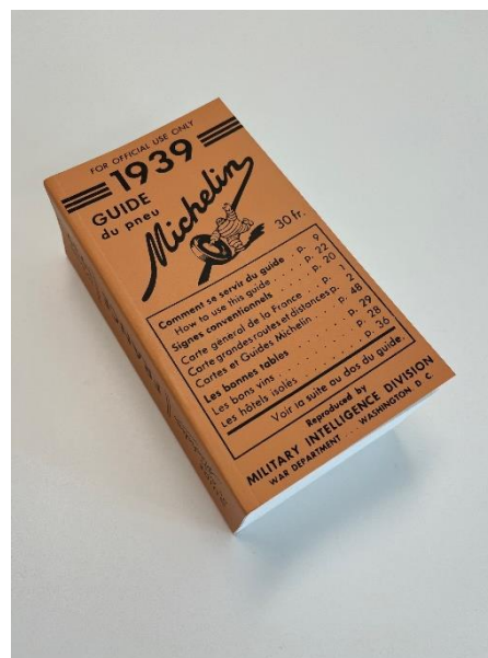
Fac-simile réédité par Michelin Éditions