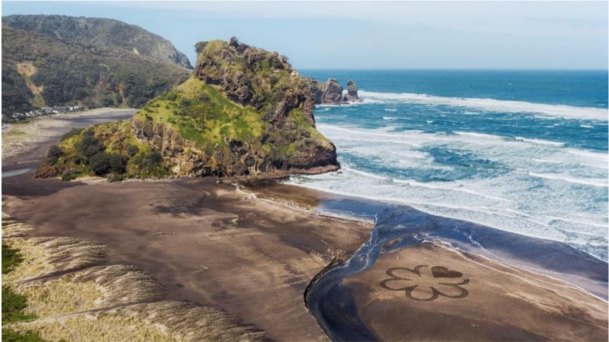
Plage de Piha, Auckland, Nouvelle-Zélande